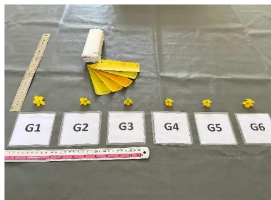
Gambar 2. Karakter bunga