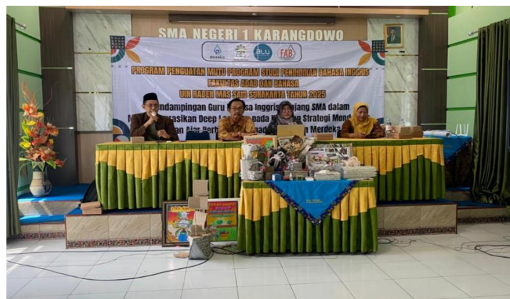
Gambar 5. Diskusi Reflektif.

Berdasarkan hasil observasi selama kegiatan berlangsung, peserta menunjukkan tingkat keterlibatan yang cukup tinggi. Sebagian besar peserta mengikuti kegiatan secara aktif, memperhatikan pemaparan materi, serta terlibat dalam diskusi dan sesi tanya jawab. Respons peserta terhadap materi yang disampaikan menunjukkan adanya ketertarikan, terutama ketika materi dikaitkan dengan pengalaman mengajar dan tantangan yang dihadapi di kelas.