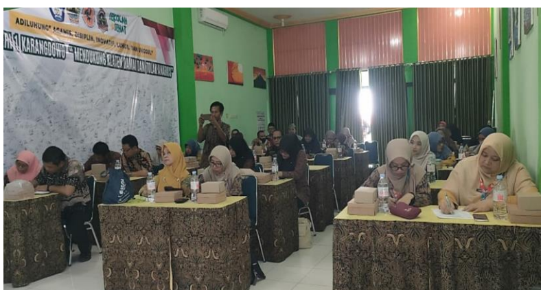
Gambar 4. Pengisian Angket oleh Peserta.

Tahap pelaksanaan dilaksanakan dalam bentuk kegiatan pendampingan satu hari yang diikuti oleh guru Bahasa Inggris jenjang SMA di Kabupaten Klaten, Jawa Tengah, sebanyak 48 guru. Kegiatan diawali dengan pengantar mengenai tujuan dan alur kegiatan, dilanjutkan dengan penyampaian materi utama yang membahas konsep deep learning dalam pembelajaran Bahasa Inggris serta pengenalan CEFR sebagai kerangka acuan pengembangan kompetensi berbahasa.