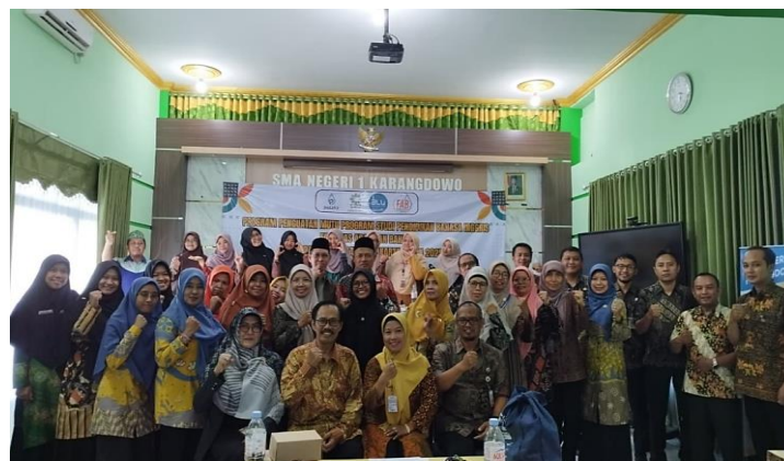
Gambar 6. Foto Bersama Pascakegiatan.

Observasi juga menunjukkan terjadinya interaksi dua arah antara pemateri dan peserta, yang tercermin dari munculnya pertanyaan dan tanggapan selama kegiatan. Diskusi yang terjadi bersifat reflektif dan berfokus pada pemahaman konsep, bukan pada praktik teknis. Hal ini selaras dengan tujuan kegiatan yang menekankan penguatan paradigma dan pemahaman awal peserta.