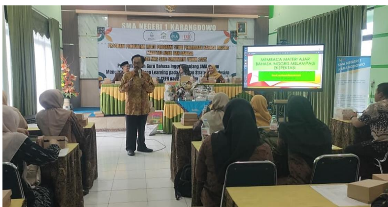
Gambar 3. Pemaparan Materi oleh Tim PKM.

Kegiatan ini dilaksanakan dalam tiga tahap, yakni tahap persiapan, pelaksanaan, dan tahap penutup. Tahap persiapan dilakukan untuk memastikan kegiatan pengabdian masyarakat dapat berjalan secara terencana dan sesuai dengan kebutuhan mitra. Pada tahap ini, tim pengabdian melakukan koordinasi awal dengan pihak mitra yaitu MGMP Bahasa Inggris Kabupaten Klaten, Jawa Tengah, untuk menyepakati tujuan kegiatan, sasaran peserta, serta waktu dan bentuk pelaksanaan kegiatan. Selain itu, tim juga mempersiapkan instrumen berupa angket terbuka dan lembar observasi.