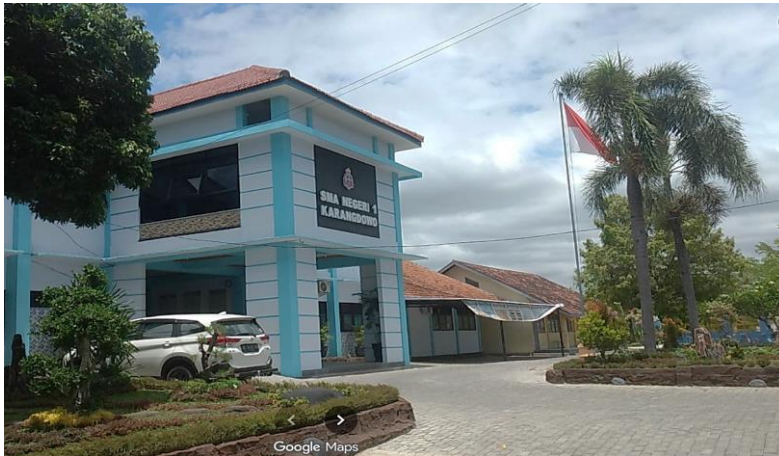
Gambar 1. Tampak Depan Gedung SMA Negeri 1 Karangdowo, Klaten.

Gambar ini menunjukkan sebuah gedung sekolah, yaitu SMA Negeri 1 Karangdowo, dengan bangunan dua lantai berwarna biru-putih. Di halaman depan terdapat area parkir, taman kecil, serta tiang bendera dengan bendera Indonesia yang berkibar. Suasana terlihat rapi, bersih, dan asri dengan pepohonan di sekitarnya.