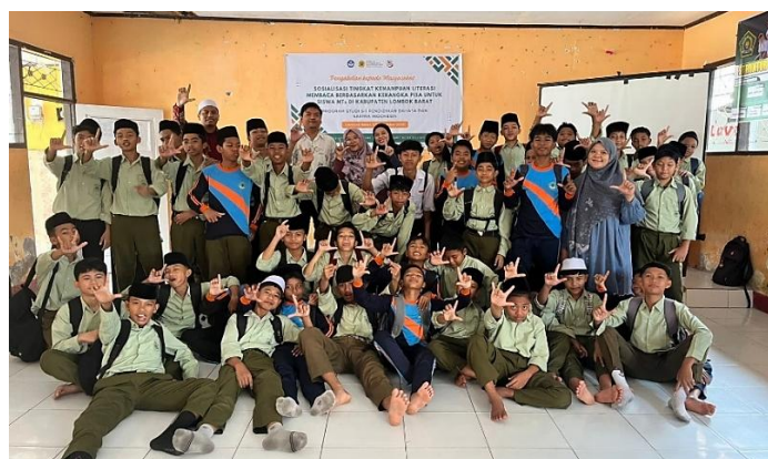
Gambar 5. Sesi Foto Bersama Menunjukkan Akhir Kegiatan Pengabdian.

Dari hasil refleksi soal yang diberikan, aspek yang paling banyak salah dijawab siswa adalah aspek menilai kualitas dan kredibilitas sumber. Dari lima soal terkait aspek ini, presentase benar siswa hanya 2—22%. Hal ini menunjukkan bahwa siswa masih mengalami kendala dalam memilih sumber bacaan yang sesuai atau kredibel.