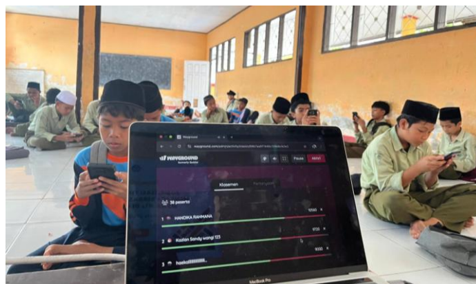
Gambar 4. Siswa yang Menjawab Soal Literasi Membaca Kerangka PISA.

Pada sesi pemaparan materi, pemateri dalam hal ini Marlinda Ramdhani juga menjelaskan bagaimana konsep literasi tersebut bisa diaplikasikan dalam kehidupan bermasyarakat. Melalui pemutaran video terkait literasi dan numerasi, pemateri memaparkan contoh dari kebiasaan siswa yang tergolong dalam kegiatan literasi membaca. Misalnya, saat siswa membaca artikel di media sosial terkait “Cara Memasak Mie Instan yang Enak”. Jika siswa hanya membaca, ia hanya akan sampai tahapan membaca artikel tersebut (menemukan dan memahami informasi). Tetapi jika siswa melakukan kegiatan literasi membaca, maka siswa akan mencermati apakah sumber artikel tersebut bisa dipercaya (menilai kualitas dan kredibilitas sumber), mencoba mempraktikkan cara membuat mi yang enak tersebut (tahapan merefleksikan isi bacaan dengan pengalaman), dan menilai langsung apakah mi yang dibuat dengan prosedur di artikel tersebut benar-benar terasa enak (memecahkan masalah).