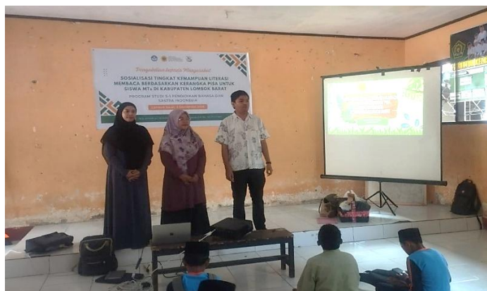
Gambar 2. Perkenalan Anggota Pengabdian.

Kegiatan pengabdian ini dilaksanakan dalam tiga sesi, yaitu pemaparan materi terkait konsep literasi membaca dan literasi membaca kerangka PISA, tes soal literasi membaca sesuai kerangka PISA, dan evaluasi hasil tes siswa. Ketiga sesi tersebut berjalan beriringan dan bertahap sesuai dengan rencana pengabdian.